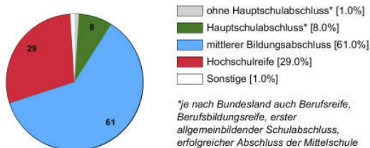
Ausbildungsbereich Industrie und Handel